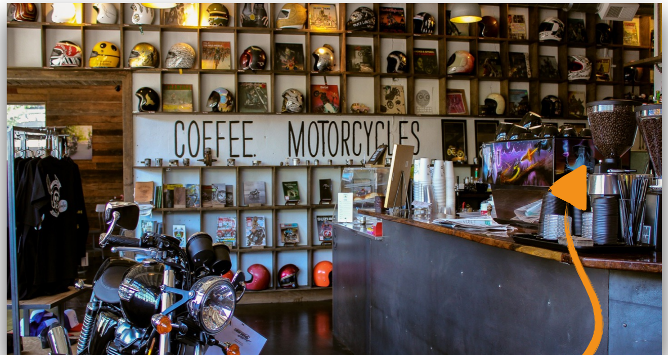
SeeSee Motor Coffee, Portland USA