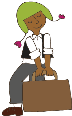
Visa de RESIDENTE TEMPORARIO