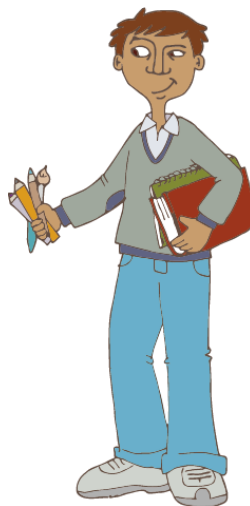
Visa de RESIDENTE ESTUDIANTE