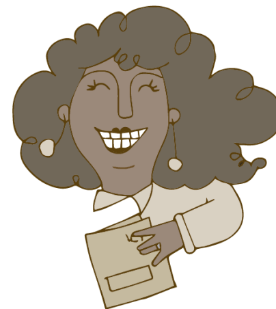
Visa de RESIDENTE SUJETO A CONTRATO

Las visas se pueden otorgar en calidad de TITULAR o DEPENDIENTE. Los Dependientes no pueden trabajar (en caso de querer hacerlo deberán solicitar cambio en la calidad de visa).